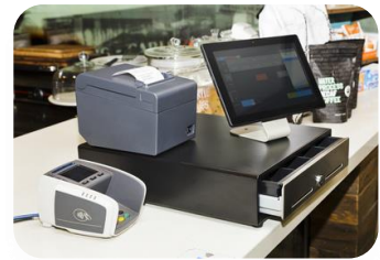
Touch-Kiosk Lösungen, elektronische Preisauszeichnung und POS-Service