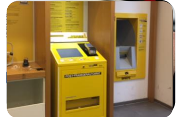
24/7 Lösungen: Systeme zur Kontaktloszahlung und Automaten für SB-Zonen