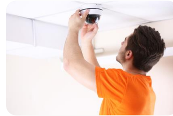
Betriebsgeländesicherung, Objekterfassung und Objekttracking